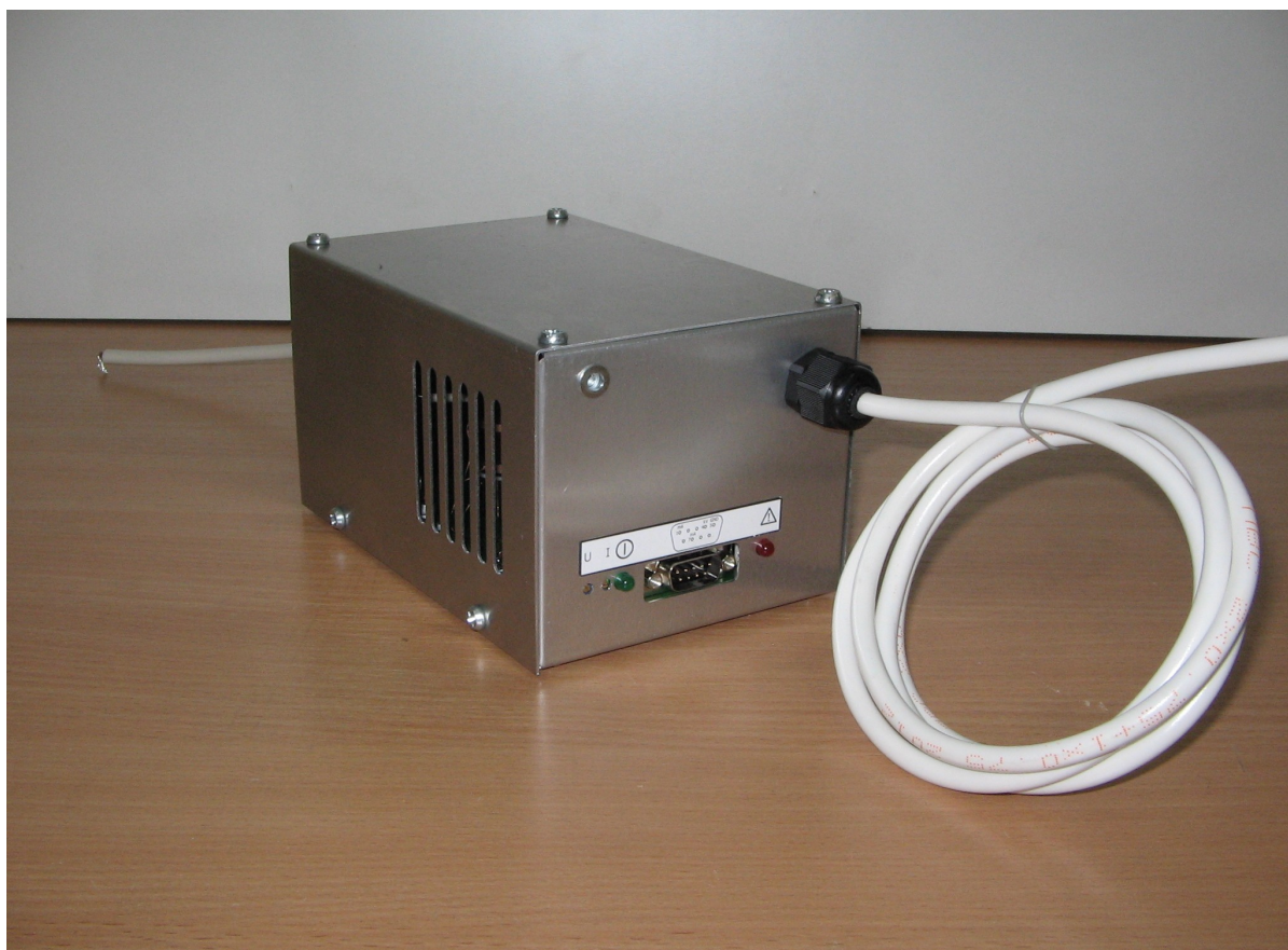
Рис. 3. Внешний вид ИВН-14-3 (10) сзади