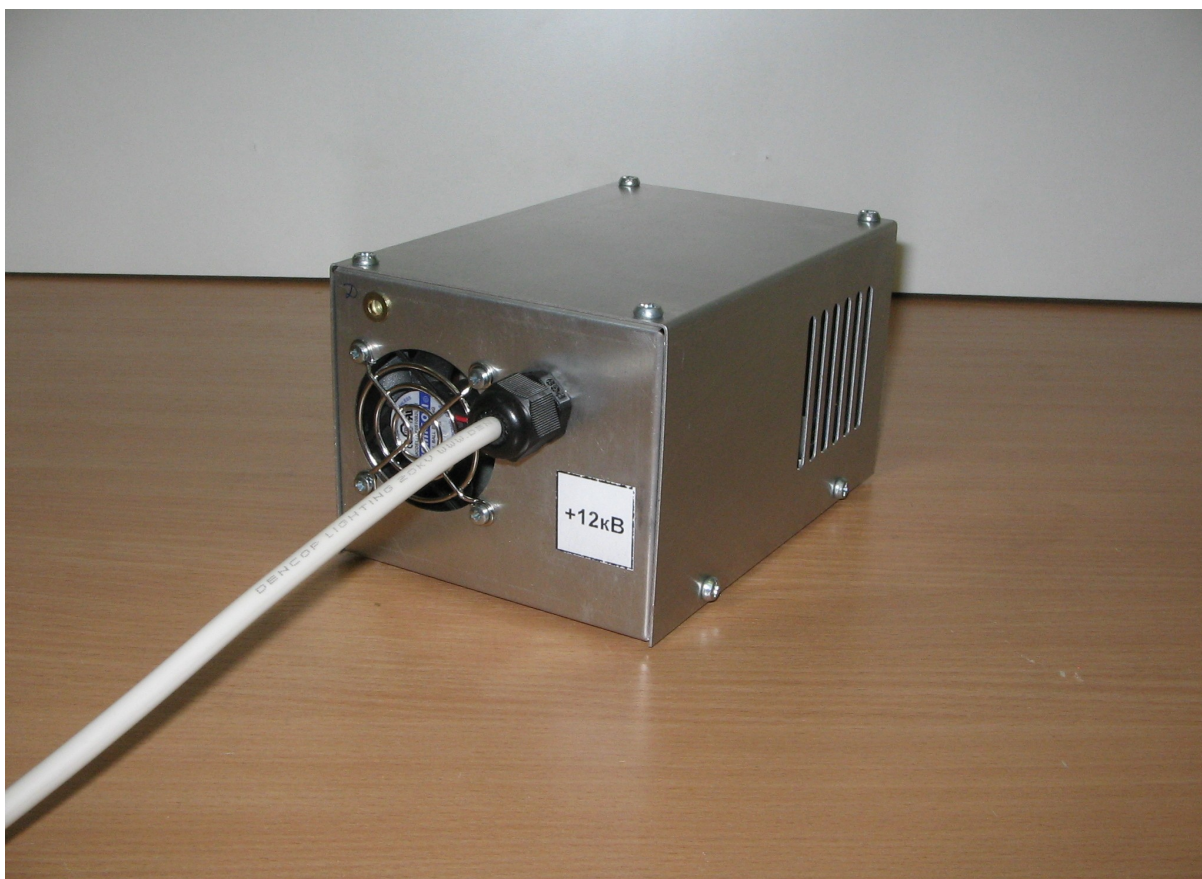
Рис. 2. Внешний вид ИВН-14-10 спереди