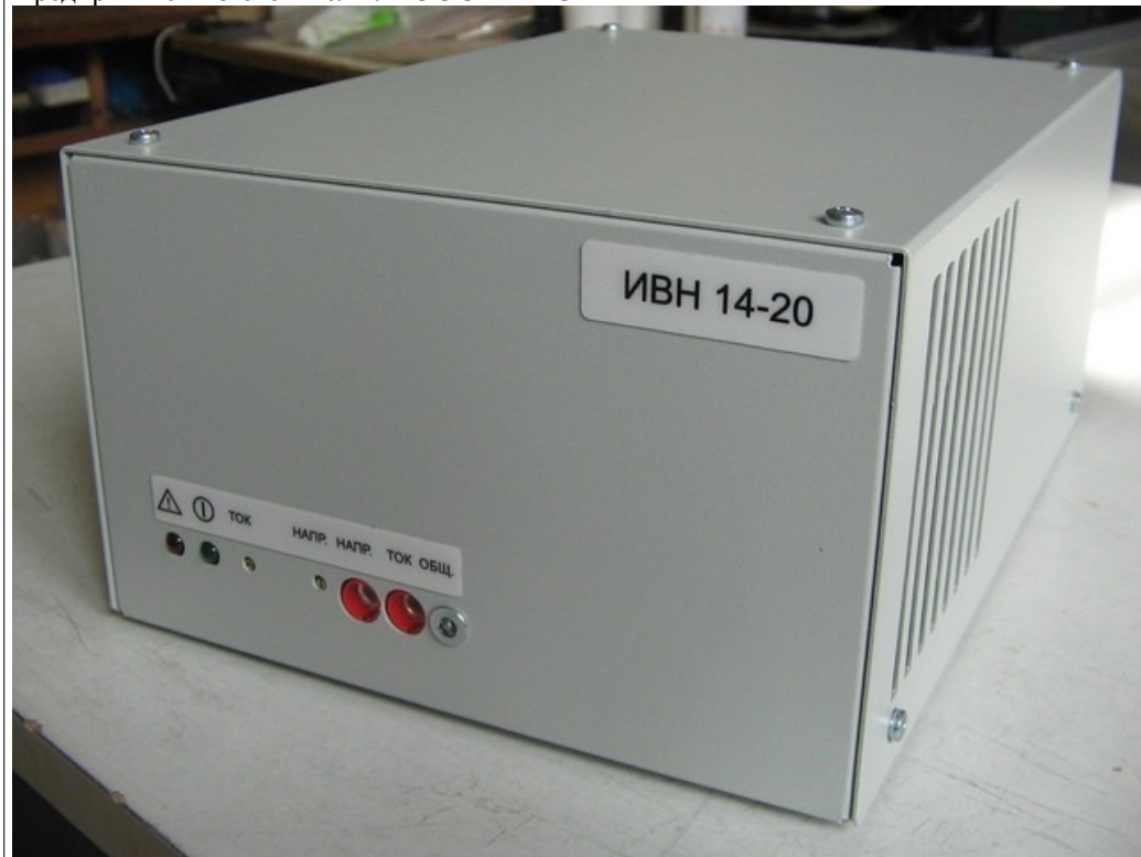
Рис.2. Внешний вид ИВН-14-20(30)

Предприятие - изготовитель : ООО "Р - С И Б"